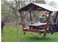
La fin de la pose des nouveaux mobiliers.