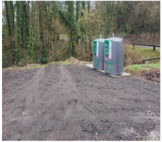
Le déplacement des bennes à verre