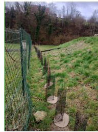
Une haie au fond du cimetière