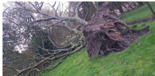
Des arbres qui tombent.