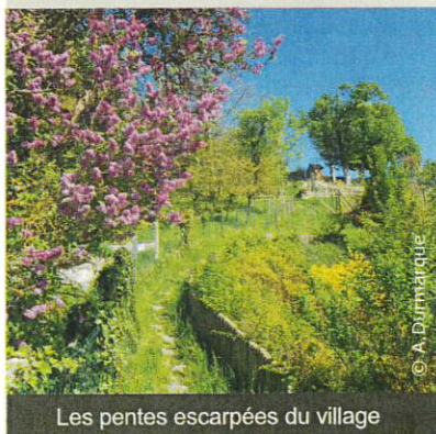
Les pentes escarpées du village